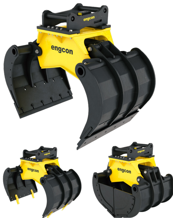
Con puntas (accesorio)

* Aplica para garras con fijación S40-S80.