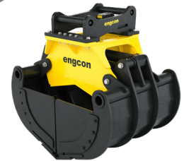
Tiiviillä kyljillä (lisävaruste)