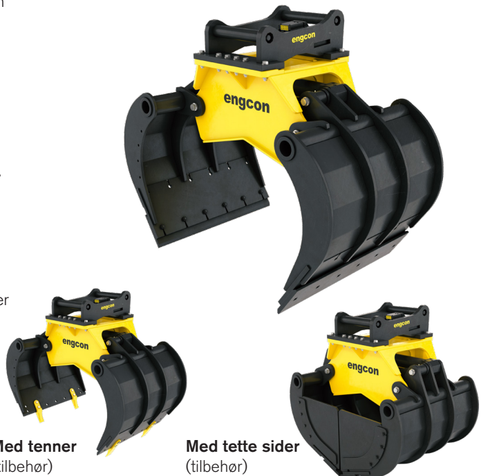
Med tenner (tilbehør)

*Gjelder klyper med redskapsfester S40–S80.