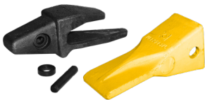
Tandenset type Cat

Tandenset verkrijgbaar als optie en wordt in het gegeven geval gemonteerd geleverd.