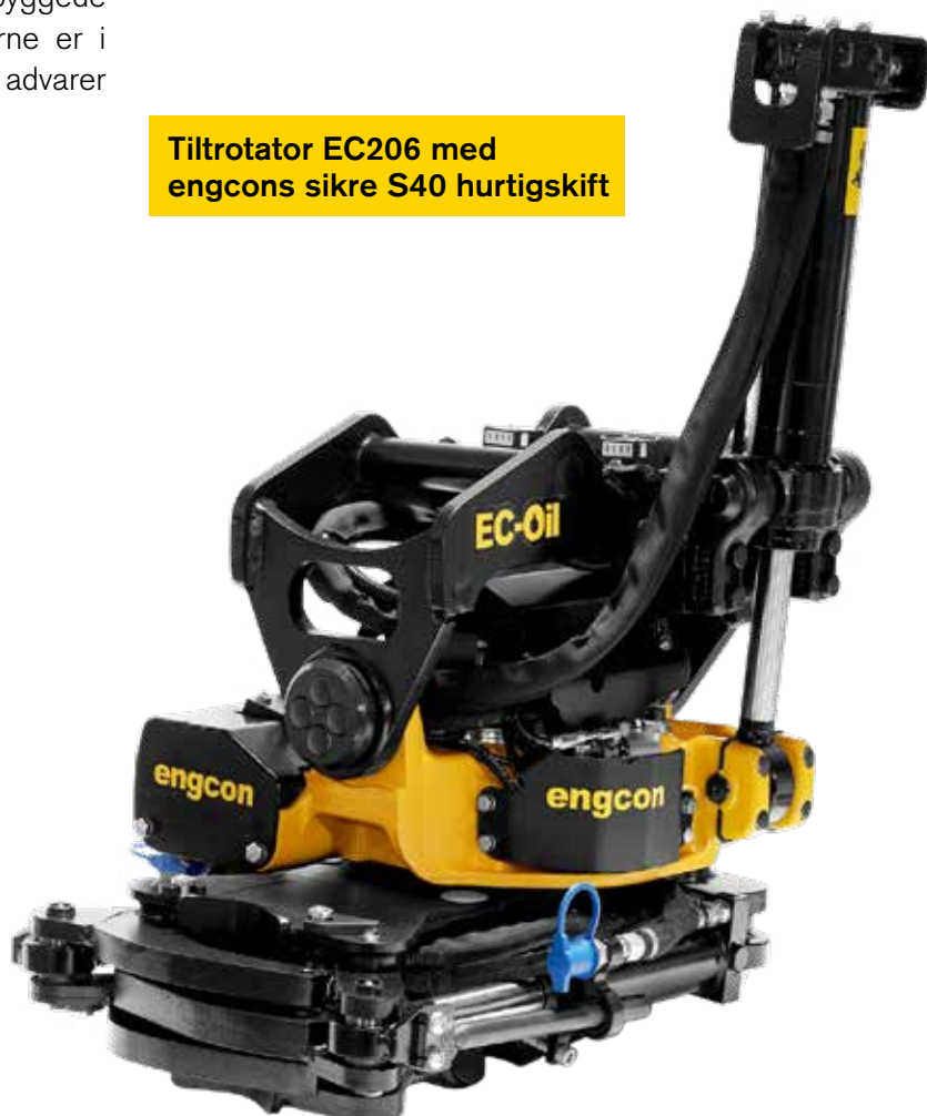
Tiltrotator EC206 med engcons sikre S40 hurtigskift

Hurtigskiftet med automatisk olie-, el- og centralsmøringstilkobling og på den øverste del af tiltrotatoren EC206 til maskiner på 4-6 ton lanceres i juni 2021. Ved årsskiftet 2021/2022 er det planen, at engcons automatiske hurtigskift også kan fås til det nederste hurtigskift på tiltrotator EC206.