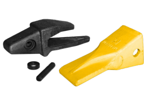
Jeu de dents type de CAT

Le godet peut également être livré avec un jeu de dents, disponible en option.