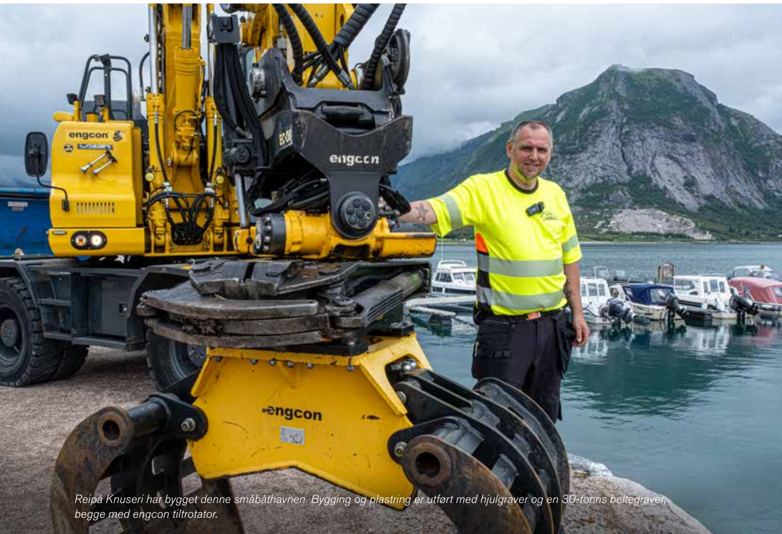
Reipå Knuseri har bygget denne småbåthavnen. Bygging og plastring er utført med hjulgraver og en 30-tonns beltegraver, begge med engcon tiltrotator.

– Med Tema-koblinger blir det søl og drefs av olje utover bakken, uansett hvor mye man prøver å være forsiktig.